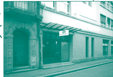
Haupteingang Adam-Friedrich-Molz-Gasse 6 2502 Biel