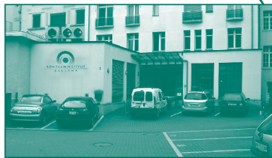
Parkplatz und Hintereingang Eisengasse 3 2502 Biel